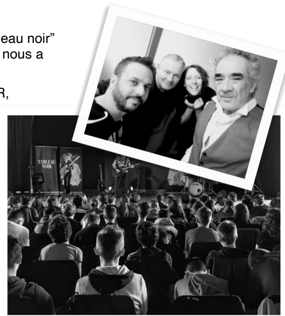
TABLEAU NOIR EFFLEURE LE MAL

Ce spectacle est une rencontre de type showcase acoustique autour des poètes du 19 e ème siècle (Rimbaud, Verlaine, Baudelaire, Apollinaire et Mallarmé) et des créations personnelles de l’artiste en chansons pop-rock, en duo guitare basse chant choeurs.